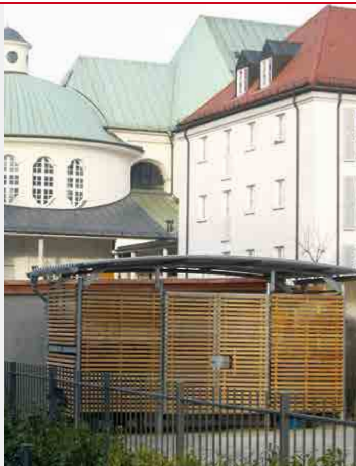
BWA® bausystem Müllereinhausung Bogendach – Modul 1 mit 2-flügeliger Tür. Wände Holzlamelle Lärche, Zubehör 2x Dachrinnen Titanzink.

Beleuchtung, Dachrinne, Pulverbeschichtung in RAL, Rammschutz.