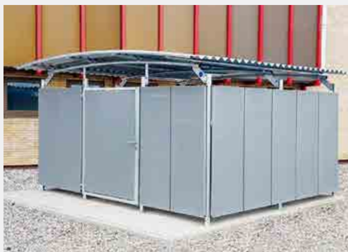
BWA® bausystem Auch die Müllereinhausung Bogendach vereint die Flexibilität eines ausgeklügelten Baukastens mit präziser Architektur. Sie schafft nicht nur Ordnung, sondern auch Raum. Über die Zeit hinaus – Wände Lochblech, RAL 9007. Ausführung Modul 2 mit 1-flügeliger Tür.