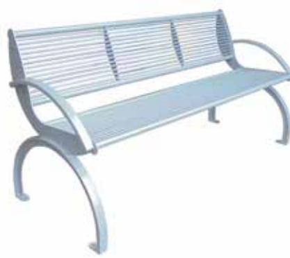
CHRISTOS Bank mit Rückenlehne, verzinkt und pulverbeschichtet.