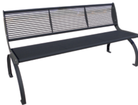
CHRISTOS Bank mit Rückenlehne und Armlehne (zusätzlich erhältlich), verzinkt und pulverbeschichtet.