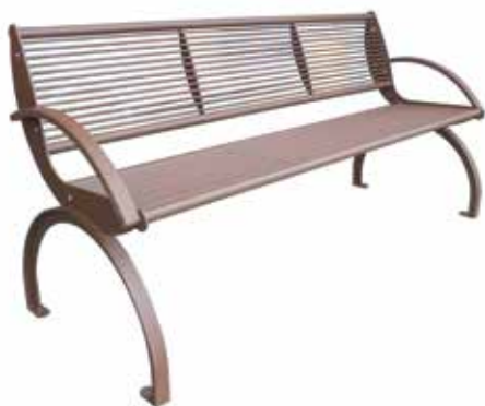
CHRISTOS Bank mit Rückenlehne, verzinkt und pulverbeschichtet.