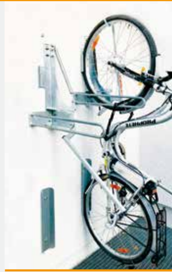
BIKE LIFT Stahl feuerverzinkt mit verstärkter Gasdruckfeder für E-Bikes bis 30 kg sowie Aufkleber „E-Bike“.