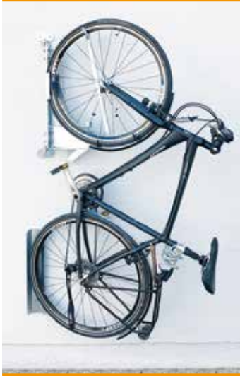
BIKE LIFT Stahl feuerverzinkt, schwenkbar