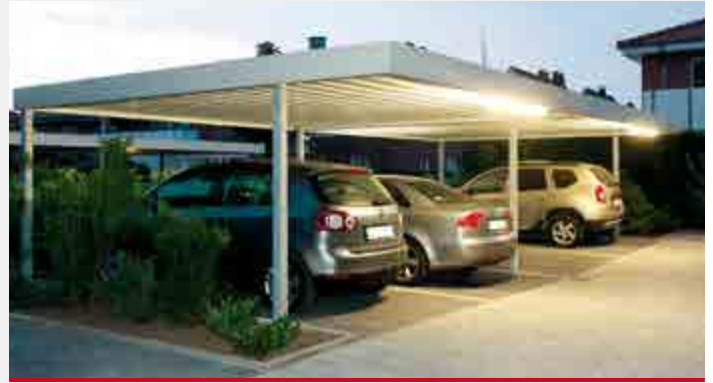
ZENO CARPORT Dachbreite x Dachtiefe 5190 x 5810 mm, Stahlkonstruktion feuerverzinkt, Dacheindeckung Trapezblech.