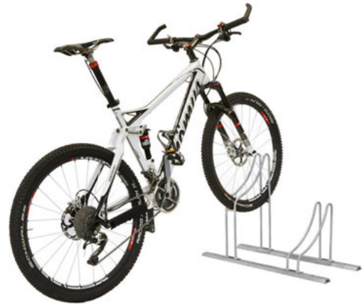
BIKECLICK® FAHRRADSTÄNDER der erste werkzeuglos aufbaubare Fahrradständer lässt sich mit einfachem Fingerdruck montieren.