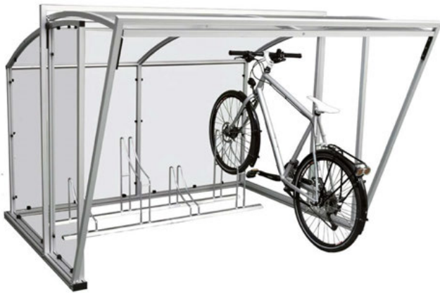
BIA L Einzelement