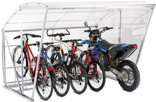
BIA XL Einzelement