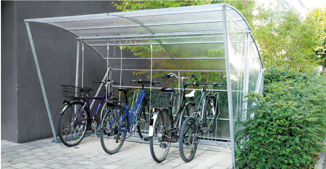
BIA XL FAHRRADGARAGE Typ 300 cm mit einer Seiten und Rückwand.