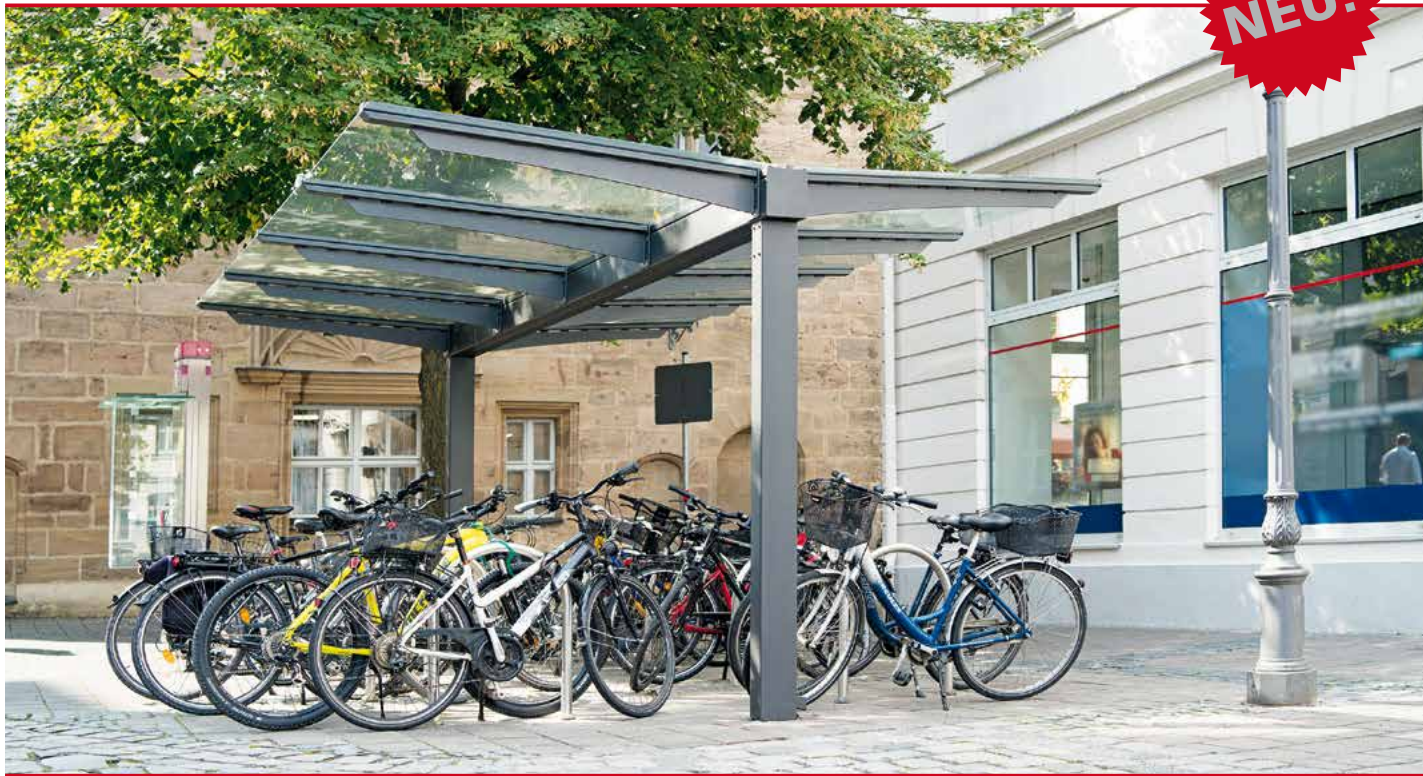
VANA FAHRRADÜBERDACHUNG Dachbreite x Dachtiefe 4720 x 4500 mm, doppelseitig, Stahlkonstruktion in DB 703 Eisenglimmer.