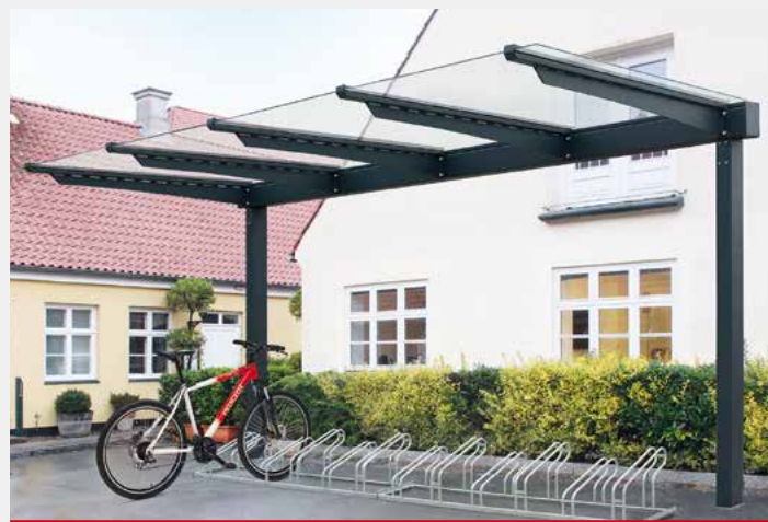
VANA FAHRRADÜBERDACHUNG einseitig, Dachbreite x Dachtiefe 4720 x 2250 mm verzinkt und pulverbeschichtet ohne Rück- und Seitenwänden.

Höhere Schneelast, keramischer Siebdruck, Beleuchtung sowie unterirdische Entwässerung gegen Mehrpreis.