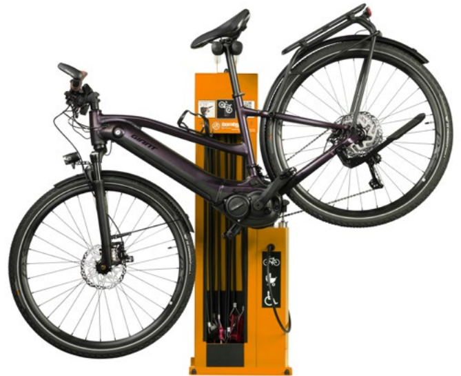
Atlas in Anwendung