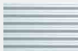
Aluminiumwellblech TP 18 / 76, waagrecht