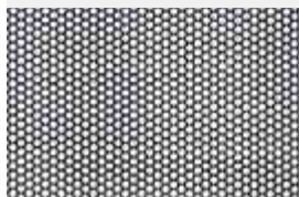
Lochblech verschiedene ø auf Anfrage