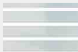
Stahlblechpaneele 160 x 21 mm waagrecht, pulverbeschichtet