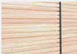
Holzbelattung Douglasie, 85 x 35 mm blickdicht, waagrecht, unbehandelt bzw. lasiert