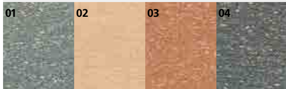
WPC-Rhombusprofil waagrecht: 01 Basaltgrau / 02 Ingwer / 03 Naturbraun / 04 Schiefergrau