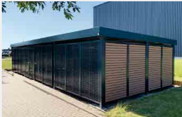
SILENOS MÜLLEINHAUSUNG Sonderabmessung ca. 12,00 x 6,00 m. Frontseite: Türen und Wände aus Quadratlochung in RAL 7016 pulverbeschichtet. Rück- und Seitenwände WPC-Lattung blickdicht.

Andere Abmessungen sowie Höhe bis 3,29 m, Carportanbau, höhere Schneelasten, Dachbegrünung, Antikondensatvlies, Beleuchtung, Dachunterverkleidung und Pfettenverkleidung.