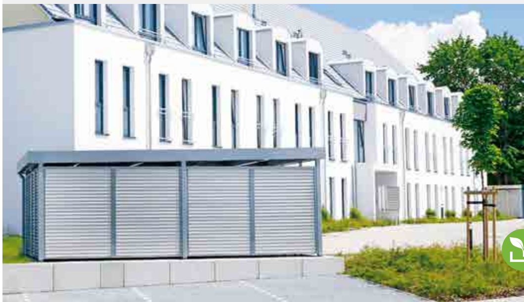
SILENOS MÜLLEINHAUSUNG Modul 4, 5,07 x 5,24 x 2,51 m Wände Stahlwelle. Passend für bis zu 7 x 1.100 L Müllcontainer.