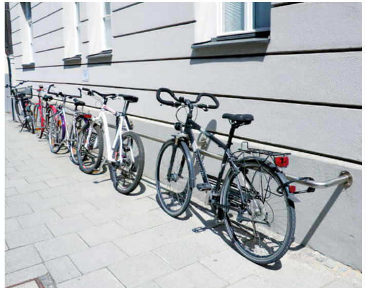
TASOS ein Anfangsbügel mit mehreren Mittelbügeln und ein Endbügel.

Zur Wandbefestigung auf Höhe von ca. 800 mm (mit runden Wandplatten Ø 150 mm).