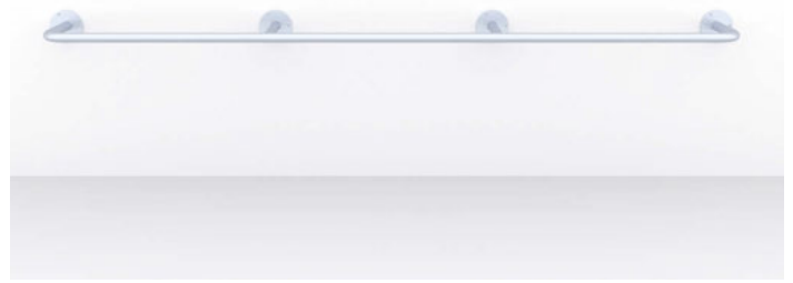
TASOS zwei Anfangsbügel und ein Mittelbügel verzinkt.