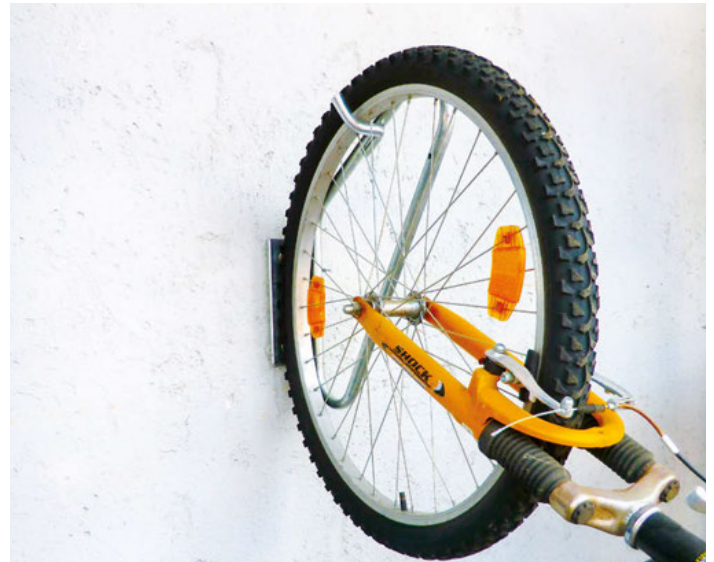
GENIA Einzelparker verzinkt zur Wandmontage.