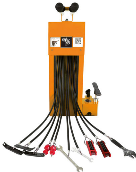
SERVICESTATION ATLAS Werkzeuge