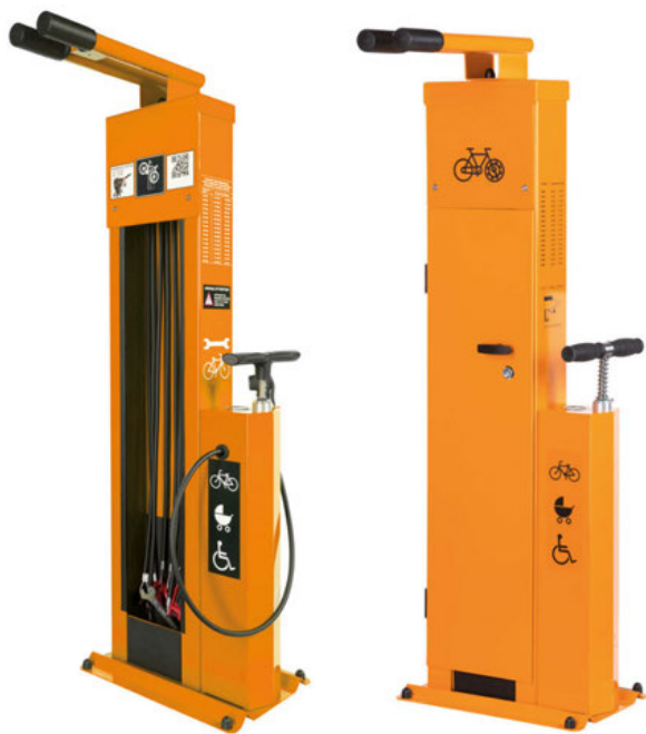
SERVICESTATION ATLAS ohne und mit optionaler Tür.