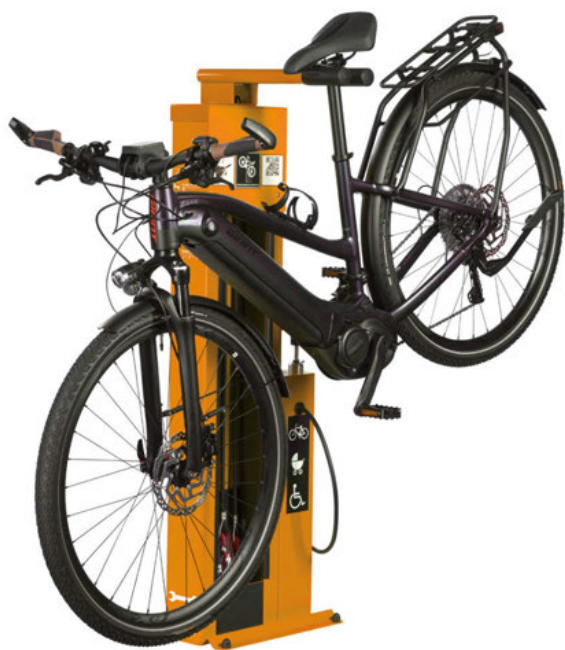
SERVICESTATION ATLAS Fahrradaufhängung zur einfachen Reparatur der Fahrradkurbel.