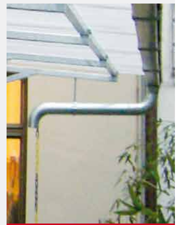
NIKI FAHRRADÜBERDACHUNG feuerverzinkt Dacheindeckung Wellplexiglas, Wabe farblos WP 76/18. 1 Grund- und 4 Anbaueinheiten. Zubehör: Fahrradparker EPSILON, Kastenrinne.