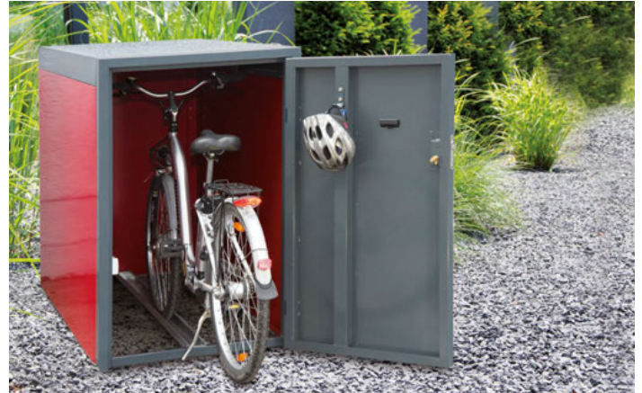
KYLON Grundelement mit Zubehör Elektroleiste inklusive LED und Pulverbeschichtung innen.