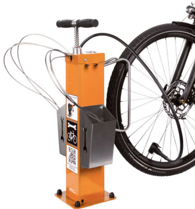
SERVICESTATION ATLAS KOMPAKT Werkzeuge