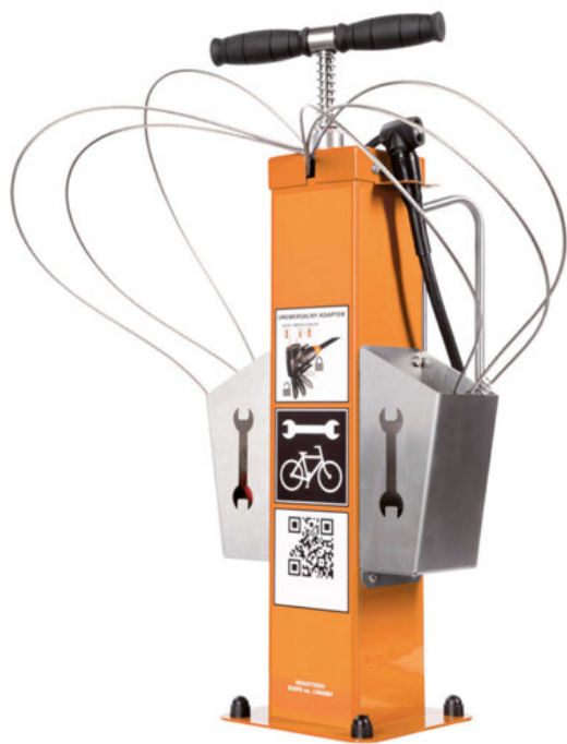
SERVICESTATION ATLAS KOMPAKT